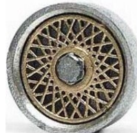
Slot.it BBS 80's