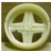
Evolution Slot Fiat