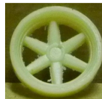
Evolution Slot Flor