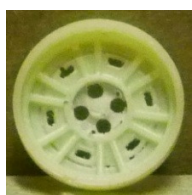
Evolution Slot BMW