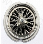
Sloting Plus Monaco Mitoos Radios Top Slot Classic

A-1-2 Tapa cubs comercialitzats per marques de slot autoritzats: