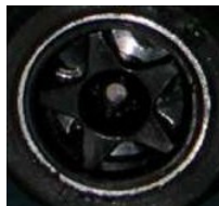
NSR 4 spokes