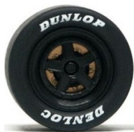
Slot.it Lancia LC2