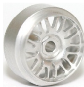
Sloting Plus America Sloting Plus Artic Sloting Plus Atlantis (1) Sloting Plus BBS (1) Excepte les de colors fosforescents.