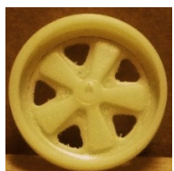
Evolution Slot Fuchs