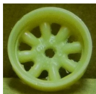
Evolution Slot Minilite