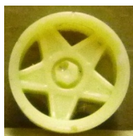
Evolution Slot Campagnolo