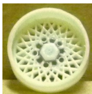
Avant Slot Alpine Evolution Slot 4 pals Evolution Slot Abarth Evolution Slot BBS