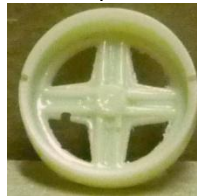
Evolution Slot Fiat