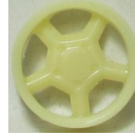
Evolution S. Opel