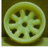
Evolution S. Minilite