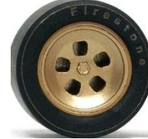
Slot.it 312 PB