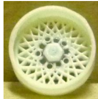
Evolution Slot BBS