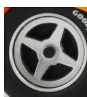
Slot.it McLaren M8D