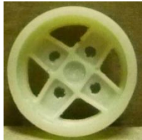
Evolution Slot 4 pals