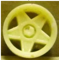
Evolution S. Campagnolo