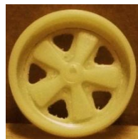
Evolution S. Fuchs