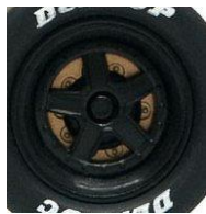
Slot.it Lancia LC2