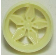
Evolution S. Stratos