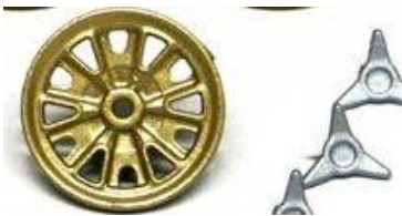
Slot.it GT40 MKI