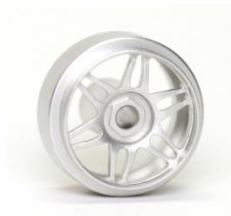
Slotting Plus Monaco