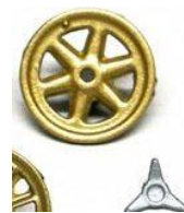
Slot.it GT40 MKII