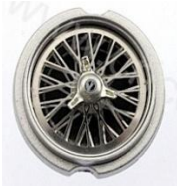
Top Slot Classic