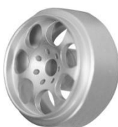
Sloting Plus Artic