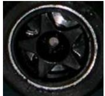
NSR 4 Spokes