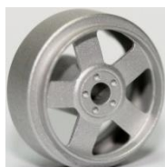
Sloting Plus Atlantis (1)