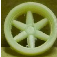
Evolution Slot Flor