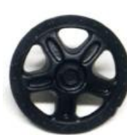
Slot.it Toyota 88