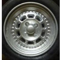
Avant Slot Alpine