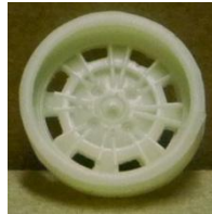
Evolution Slot Abarth