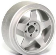
Sloting Plus America (1) Excepte les de colors fosforescents.

A-1-1 Llantes d'alumini comercialitzades per marques de slot autoritzades sense tapa-cubs: