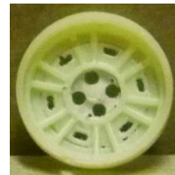
Evolution Slot BMW