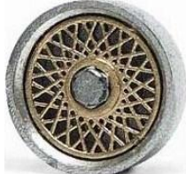
Slot.it BBS 80