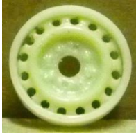
Evolution S. Turisme