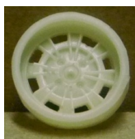
Evolution Slot Abarth