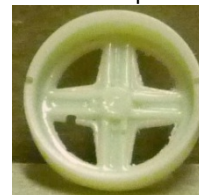
Evolution Slot Fiat