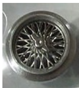
Mitos Radios Classic