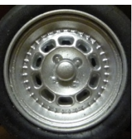
Avant Slot Alpine

A-1-2 Tapa cubs comercialitzats per marques de slot autoritzats: