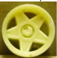
Evolution S. Campagnolo