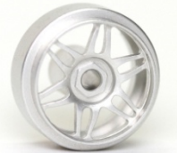
Slotting Plus Monaco