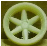
Evolution Slot Fior