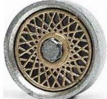
Slot.it BBS 80'