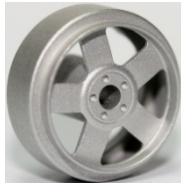
Slotting Plus Atlantis (1)