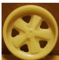
Evolution S. Fuchs