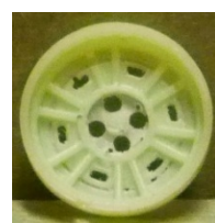
Evolution Slot BMW