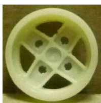
Evolution Slot 4 pals