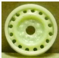
Evolution S. Turisme