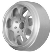
Slotting Plus Artic