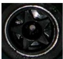
NSR 4 Spokes